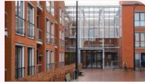
Hof Cruininghe Kruiningen