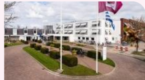
Ter Weel Krabbendijke Krabbendijke