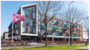
Sint Maarten in de Groe Goes