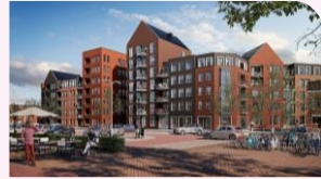
Residence 't Gasthuis Goes