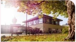
Ter Weel Goes Goes