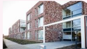
De nieuwe Vliedberg Rilland